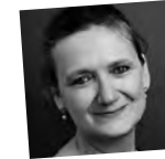
Isabelle Danel film critic

She is a British documentary film maker and cinematographer, well known for making films that highlight the plight of female victims of oppression or discrimination. Longinotto has made more than 20 films, usually featuring inspiring women and girls at their core. She's delved into female genital mutilation in Kenya ( The Day I Will Never Forget , 2002), women standing up to rapists in India ( Pink Saris , 2010), and the story of Salma (2013), an Indian Muslim woman who smuggled poetry out to the world while locked up by her family for decades. Sisters in Law , set in Kumba, Cameroon, won two prizes at Cannes in 2005. She has received a number of international awards for her films over the years, including a BAFTA for her documentary Pink Saris . Longinotto is an observational filmmaker.