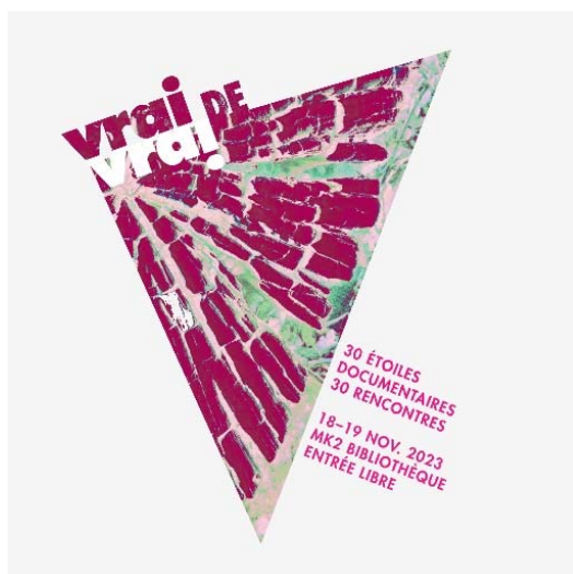
Graphisme Catherine Zask